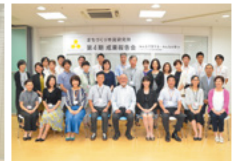
市民研究員の皆さん、ディレクター、関係者の皆さん、1年間ありがとうございました。