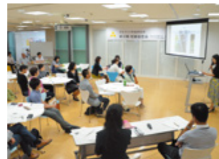
成果報告会の様子。14名の発表に熱がこもります。