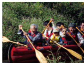
高橋ゼミ | 神谷でEボート試乗会