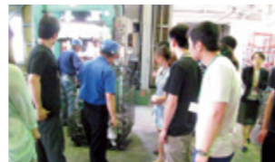
村山ゼミ | 企業の情報発信