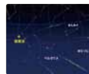
国立天文台 天文情報センター