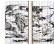
異獣(「北越雪譜」新潟県立歴史博物館所蔵)