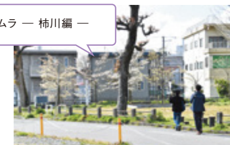
ただの散歩と侮ること無かれ！ 歴史を感じる歩き方とは!?