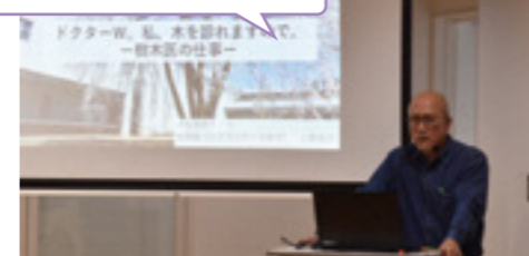
“樹木”専門のお医者さん 樹木医の仕事とは!?