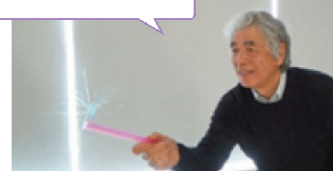
身近にあるもので簡単に作れる！ 静電気のおもちゃ♪