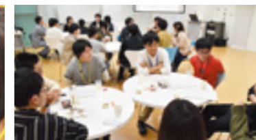
初対面でもゲームをすれば盛り上がる!