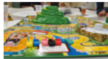
交流広場の机をつなげて人生ゲーム♪