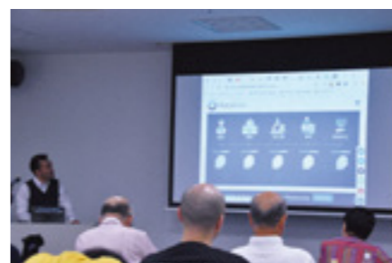
2019年6月に開催した講座の様子

講師経験のない市民の皆さんの新たなチャレンジ(講師挑戦)を応援するため、市民の皆さんが企画する講座(市民プロデュース講座)を募集します。ご応募いただいた講座企画は、審査を経て開催が決定します。決定した講座は2020年度の開催に向けて、まちキャンがサポートします。「講師をやってみたい!」、「講座を開催してみたい!」という方は、ぜひご応募ください。詳細は、「まちキャン通信11月号」をご覧ください。