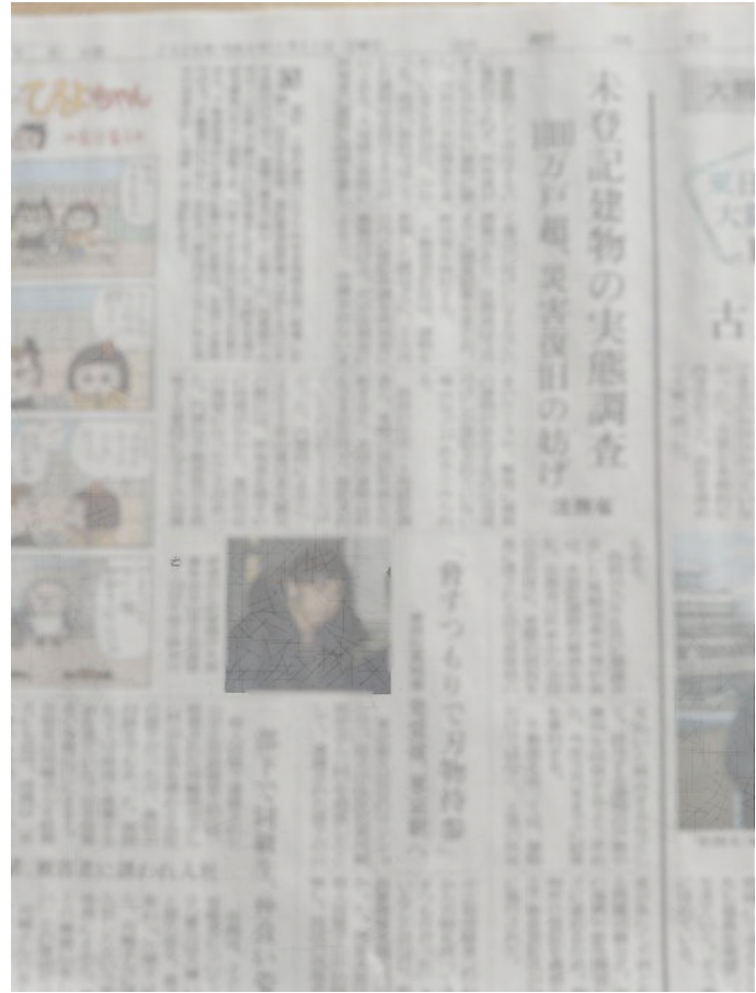
2026.01.11新潟日報 未登記物件の実態調査 法務省 大規模災害時に復旧の妨げになる 全国の建物6240万戸・登記済5160万戸=82.3% 実際の状況を基に課される固定資産税の支払いと照合し て戸数や種別を回答するように求めた