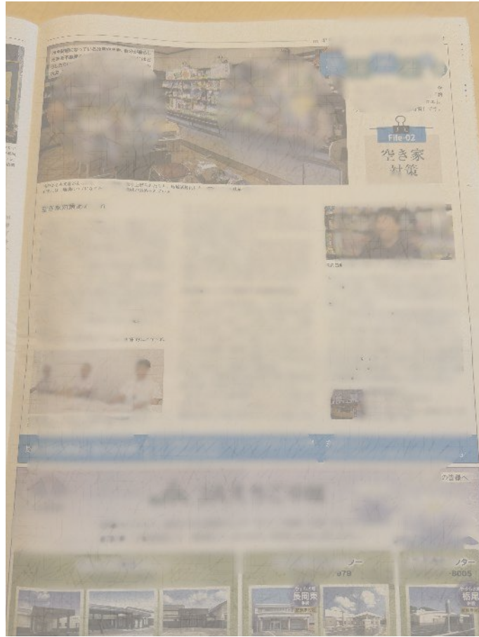
2025.11.02新潟日報assh(PR版) 空き家対策-長岡市都市整備部都市政策課 住まいのエンディングノート・空き家バンク 3000万の税制優遇・建物利活用