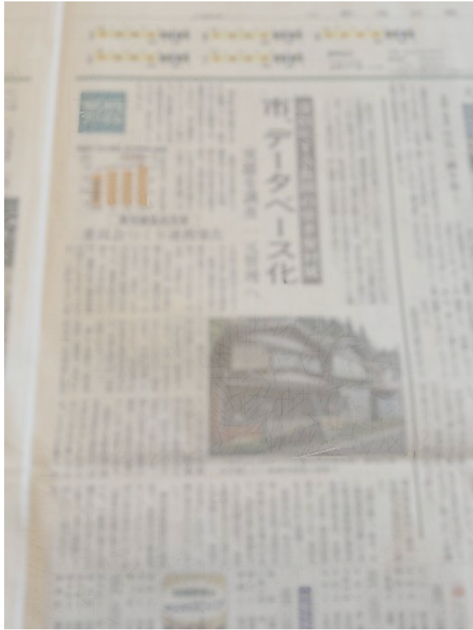
2025.05.08新潟日報 長岡市空き家対策で5年振りに実態調査 「空き家予備軍」の調査発表を 望みます。