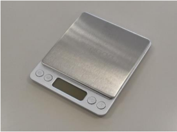
デジタルスケール