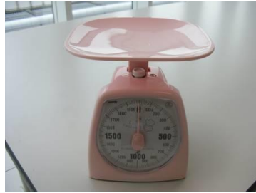
キッチンスケール