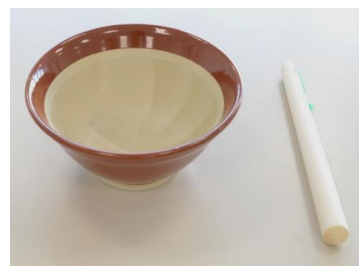
すり鉢・すりこぎ