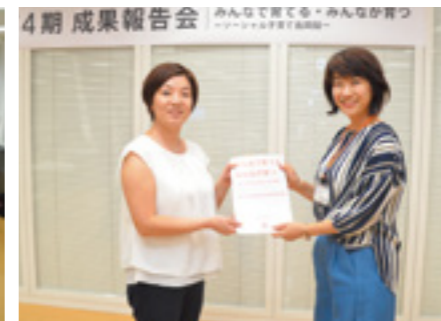
今回の研究成果を波多子ども未来部長へ提出。