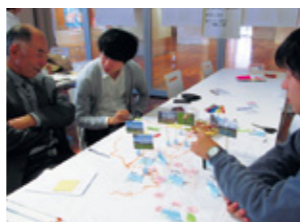
米山ゼミ | 栖吉地区調査