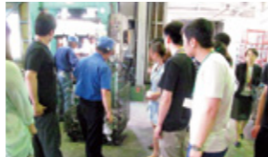
村山ゼミ | 企業の情報発信