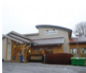
ウブサラ県農村部の初期医療センター