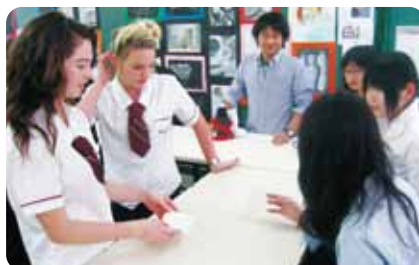
海外派遣研修での現地高校生との交流