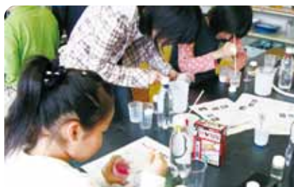
小学生を対象にした「人イクラ」の実験