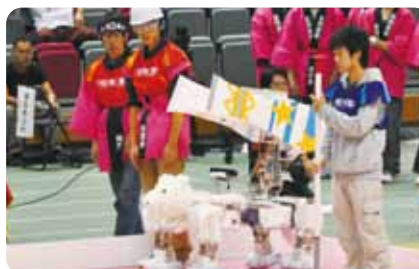
ロボコン2012「大犬闘(だいけんとう)」長岡高専は、アイデア賞、特別賞を受賞