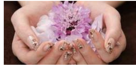
きれいな爪で好感度UP!

少しのお手入れで、爪は見違えるほど美しくなります。家庭でできる爪のケア方法、美しいカットのしかた、自分でできる簡単ネイルアートを学びましょう。男性の参加も大歓迎です。