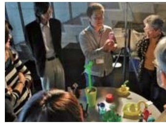
昨年開催した体験講座の様子

7月23日(土)のまちなかキャンパス体験講座は、初めての“夜カフェ”。夏の宵にピッタリの楽しい2講座をセレクトしました。大手通の歩行者天国を楽しみながら、「まちなかカフェ」に寄ってみませんか?