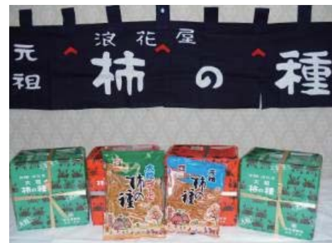
スタンダードな柿の種はもちろん、大粒、チョコレートがけ、意外な変り種も!?

長岡発祥の米菓「柿の種」の誕生秘話から最新商品の動向、柿の種のごぼれ話や意外な食べ方を紹介します。様々な柿の種を食べ比べながら奥深い柿の種の世界に浸ってみましょう。