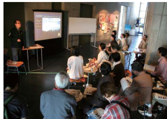
天気予報やデザイン、ロボット等、今まで、さまざまなテーマでまちなかカフェの体験講座を開催しました。